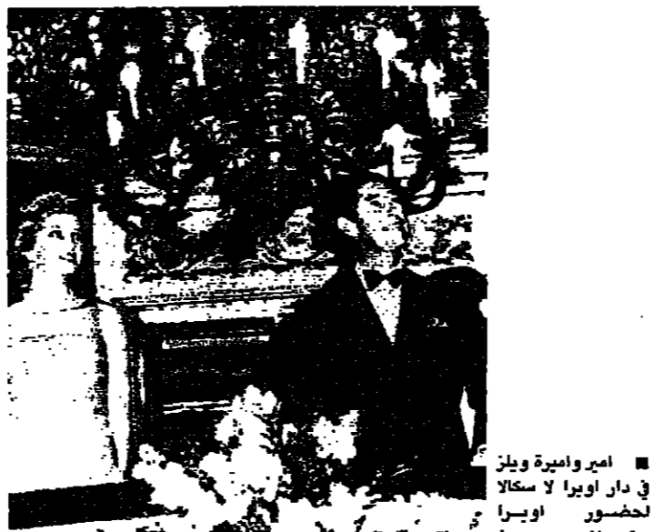
أمير أمير ويلز في دار أوبرا لا سكاليا بحضور أمير أوسيرا - تورونتو - موت كلوب (أ.ب.)

ذكرت صحف بريطانية أمس أن أحد اقرب الأمير تشارلز وولي عهد انكلترا كان ضابطا برتبة جنرال في قوات العاصفة النازية. وقالت صحف بريطانية أمس أن أحد اقرب الأمير تشارلز وولي عهد انكلترا كان ضابطا برتبة جنرال في قوات العاصفة النازية.